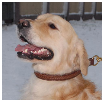
Foto: Collar doble adornos trenzados