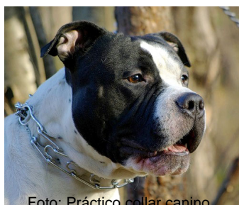
Foto: Práctico collar canino

¡Atención! Si el pelo de Su perro es propenso a teñirse con los collares metálicos, les recomendamos probar nuestros collares hechos de curogán, latón y acero inoxidable. Estos metales no llevan recubrimiento (baño) y posiblemente irán mejor a Su perro.