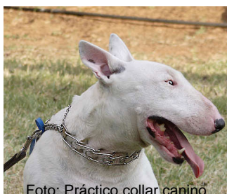
Foto: Práctico collar canino