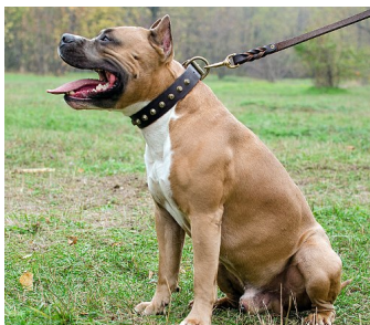
Foto: Collar decorado conos laton perro mediano