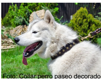
Foto: Collar perro paseo decorado