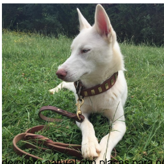
Foto: Collar canino de cuero natural con placas para perro Husky pequeño