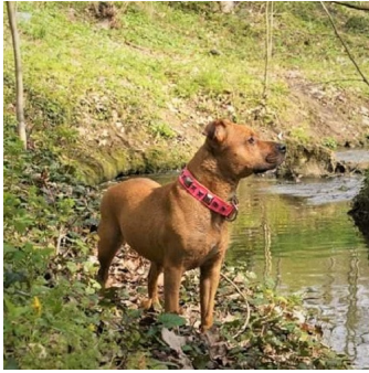
Foto: Collar adornado perro amstaff