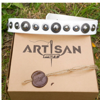
Foto: Collar de cuero blanco con adornos de marca FDT Artisan