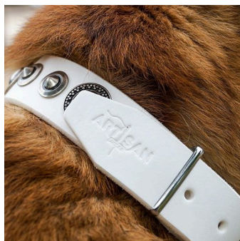
Foto: Collar con forniture cromada para perro Malinois