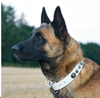
Foto: Collar de cuero blanco con adornos plateados de modelo «La edad de hielo»