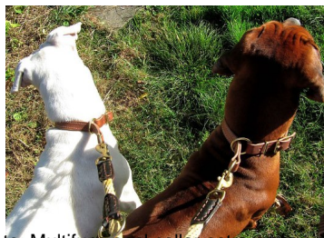
Foto: Multifuncional collar estrangulamiento