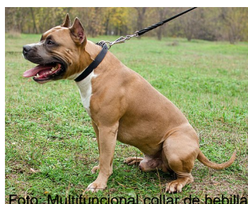
Foto: Multifuncional collar de hebilla