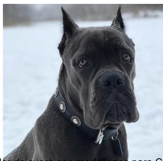
Foto: Collar de cuero con medallones para Cane Corso