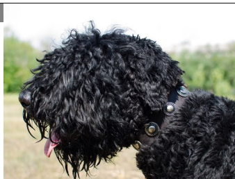
Foto: Collar decorado con medallones