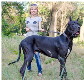
Foto: Collar canino de paseo perro grande