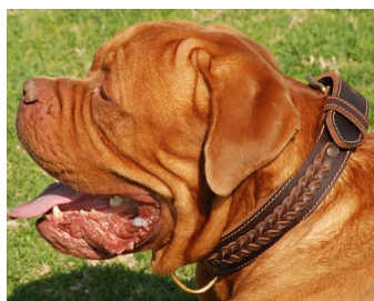
Foto: Collar ancho de cuero doble